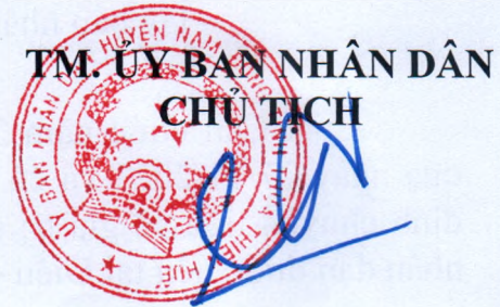
Trần Quốc Phụng